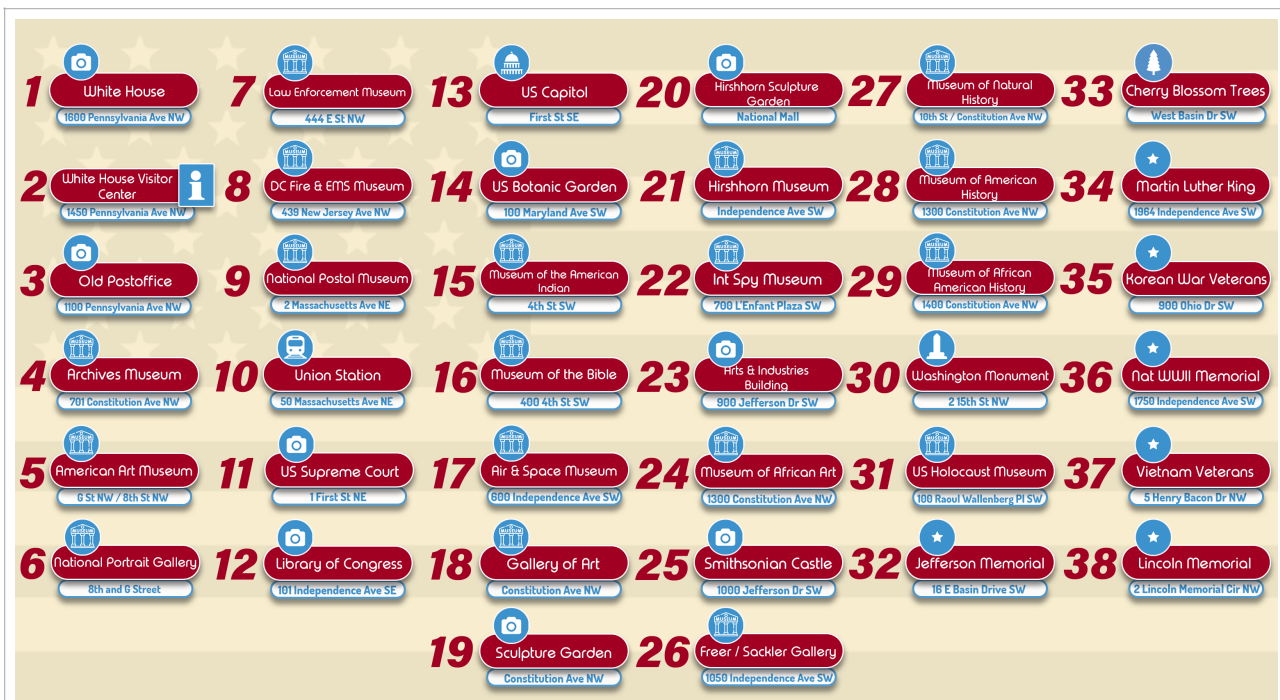
Legenda van de activiteiten in Downtown Washington DC